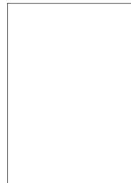
Frau Nowotsch -51